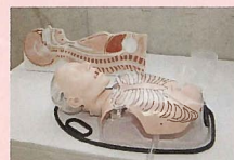
経管栄養シミュレーターも完備

単科校にしかできない最高の実習施設を備えています。充実した学びの環境で、経験豊富な教員がリアルな授業を行い、介護の現場で活躍できる介護福祉士を目指せます。